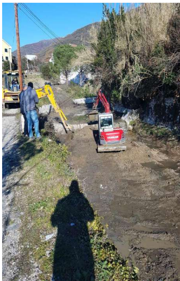
POTOK U BEOGRADSKOJ ULICI