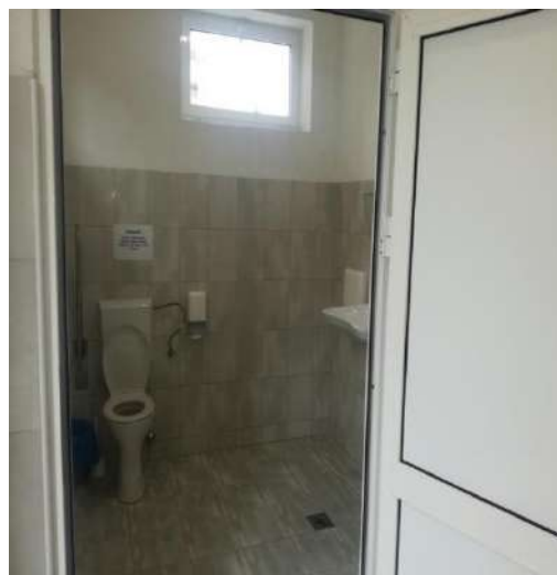
KABINA ZA LICA SA INVALIDITETOM