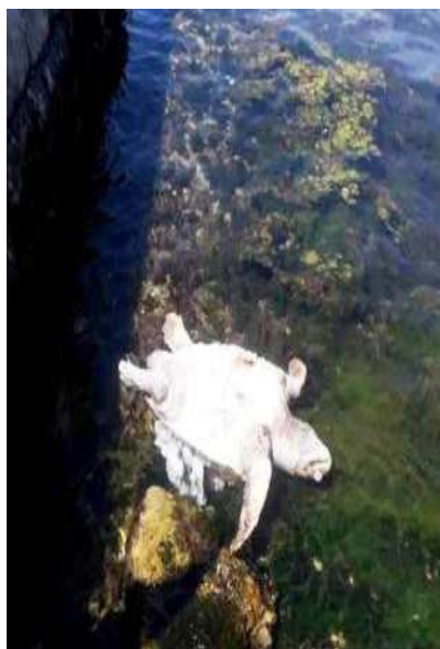
FOTOGRAFIJE UGINULIH ŽIVOTINJA

5. ČIŠĆENJE ŠUTA i drugih otpadaka koji ne spadaju u otpad iz domaćinstva vrši se po potrebi. Ovi poslovi obavljaju se povremeno, a u toku priprema za turističku sezonu moraju biti organizovani tako da se iz svih naselja pakuje i odvezu do trajne deponije predviđene za ovu vrstu otpadaka. Nisu rijetki slučajevi da ova vrsta otpada završava pored posuda za odlaganje otpada ili divljim deponijama.