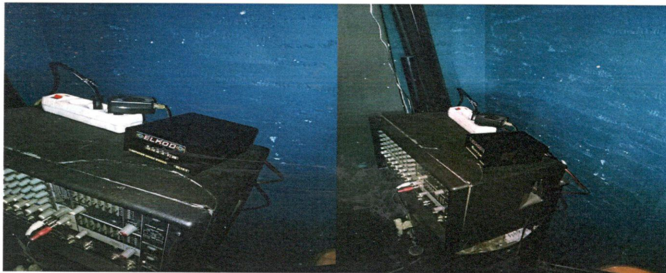
Slike br. 6.1, 6.2 - Položaj podešenog limitatora zvuka unutar predmetnog objekta

Limitator zvuka unutar predmetnog objekta nalazi se na mikseti tipa „YAMAHA EMX212S“. Limitator je postavljen na sistemu između miksete i pojačala.