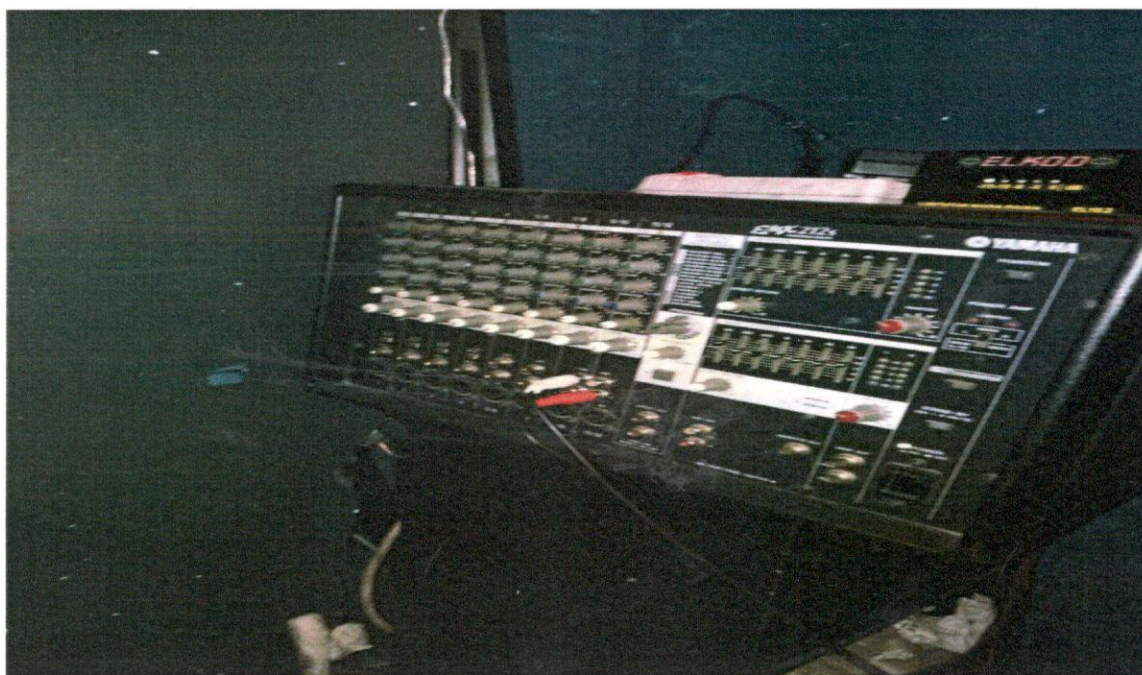
Slika br. 5.1 – Mikseta-pojačalo tipa „YAMAHA EMX212S“ sa položajem kružnog potenciometra

Zvuk koji se emituje putem opisanih muzičkih uređaja je promjenjiv, u zavisnosti od efekta koji hoće da se postigne, i sadrži zvučne informacije sa jasno prepoznatljivom muzikom.