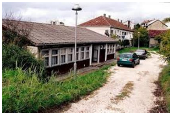
Škola od 1980 – 2008.g.