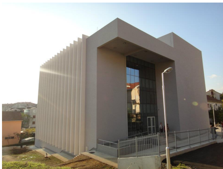
Školski objekat od 2011.g.

Škola je sa radom u novom objektu započela od šk: 2012/13.g.