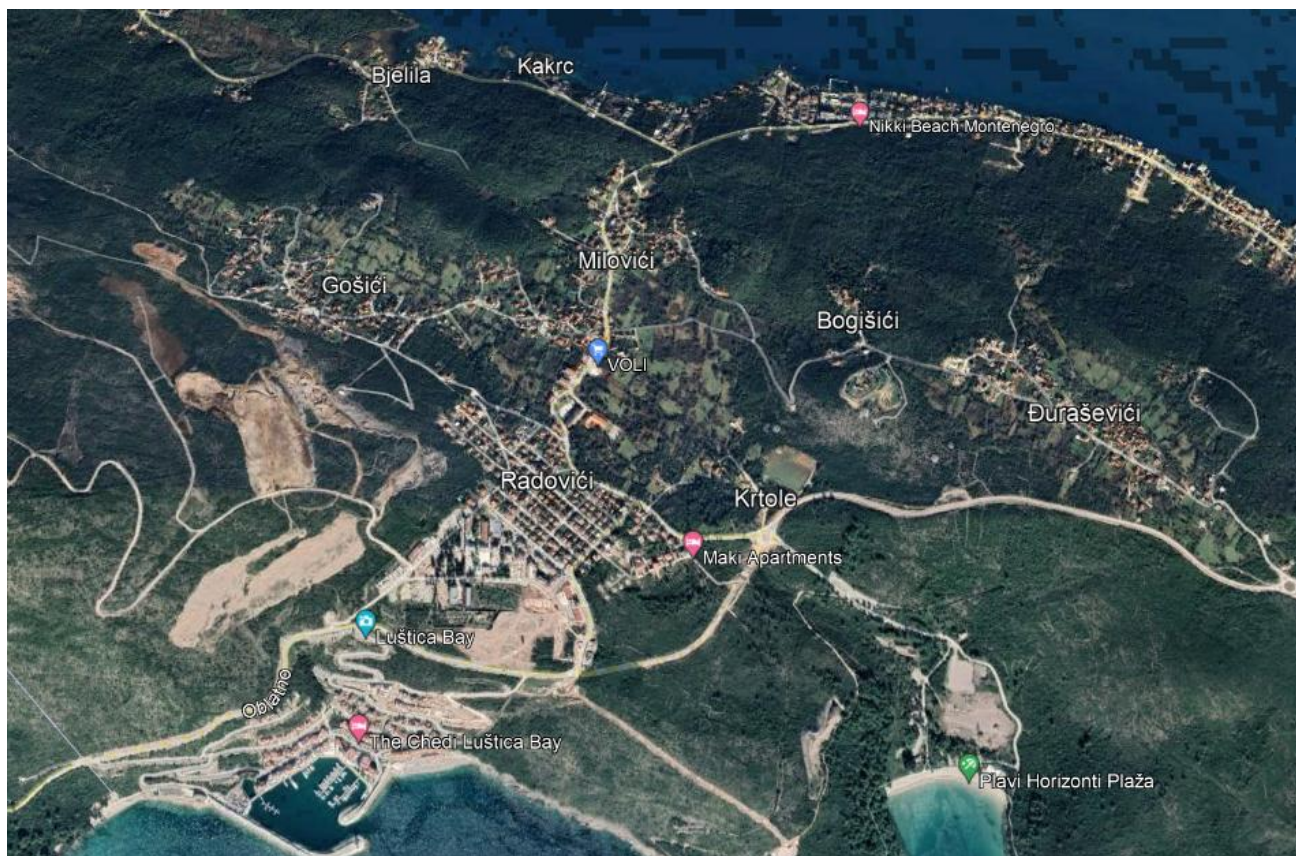
Slika 1. Panorama dijela Opštine Tivat, naselja Radovići i njegove okoline gdje se nalazi lokacija objekta

Na slici 1. prikazana je panorama dijela Opštine Tivat, naselja Radovići i njegove okoline gdje se nalazi lokacija objekta.