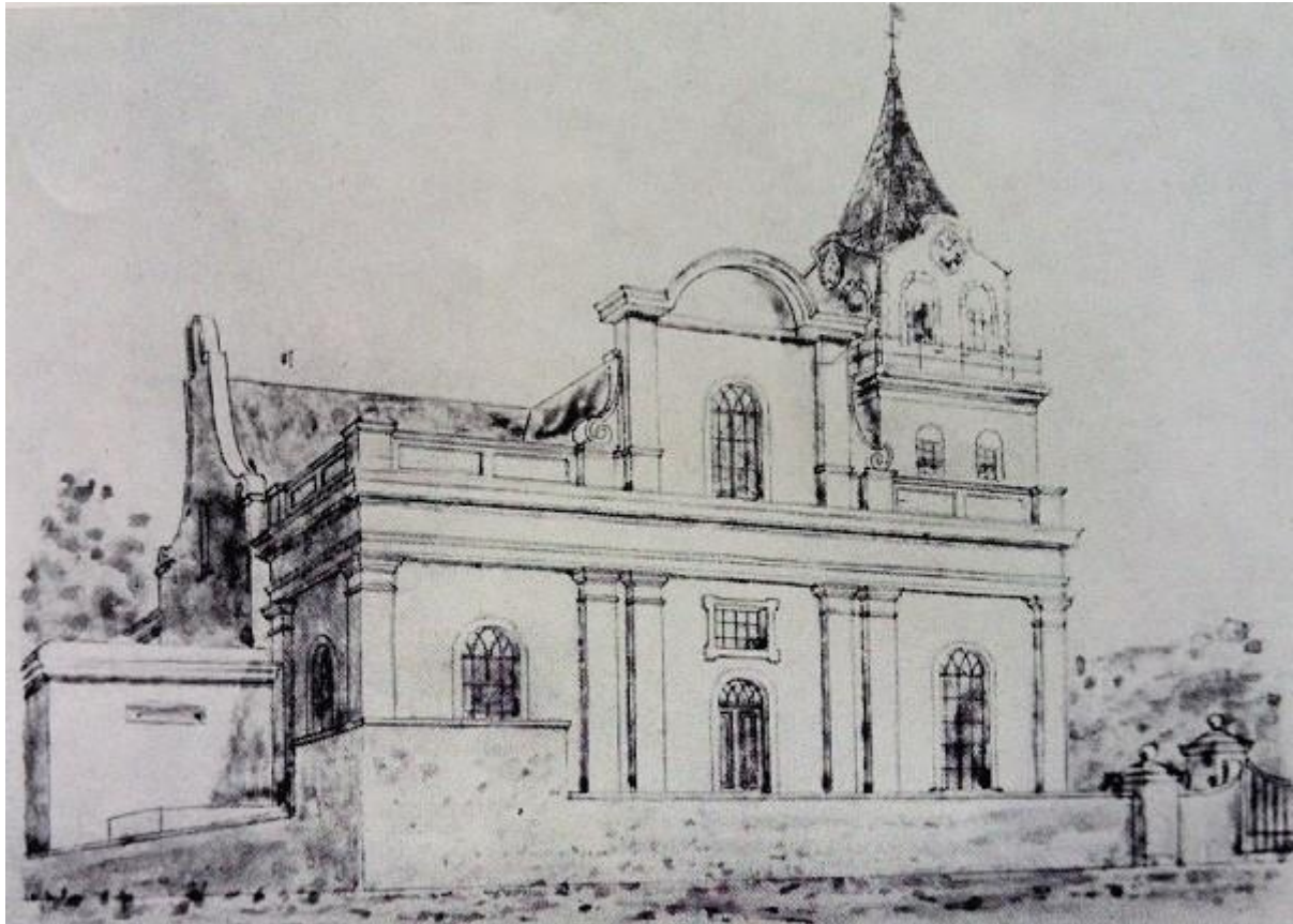
Die kerk van 1704, in 1832 gesloop.