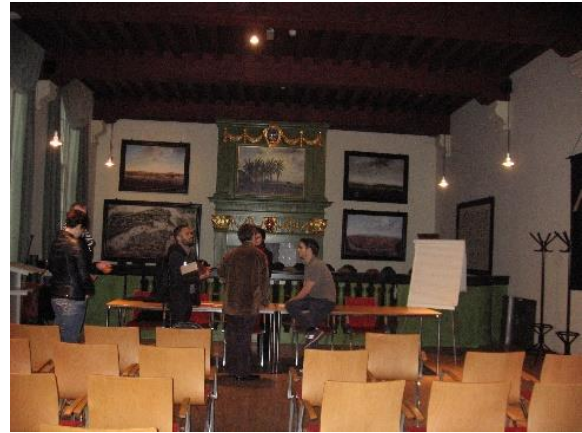
Raadsaal met karate aan mure. Here XVII vergadering om Prins Willem van hoofdparticipant aan te stel. (Regs) As lesingkamer van Universiteit van Amsterdam.