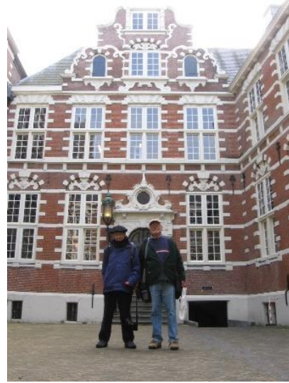
VOC Hoofgebou in Hoogstraat, Amsterdam (links) 1680 en (regs) 2012